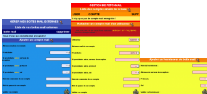
Ajouter un compte

Pour ajouter un prestataire dans la liste, il faut passer par : PORTAIL ⇒ Administration ⇒ Gérer la messagerie ⇒ Gérer fetchmail ⇒ Ajouter un fournisseur de boîte mail et indiquer les mêmes éléments.